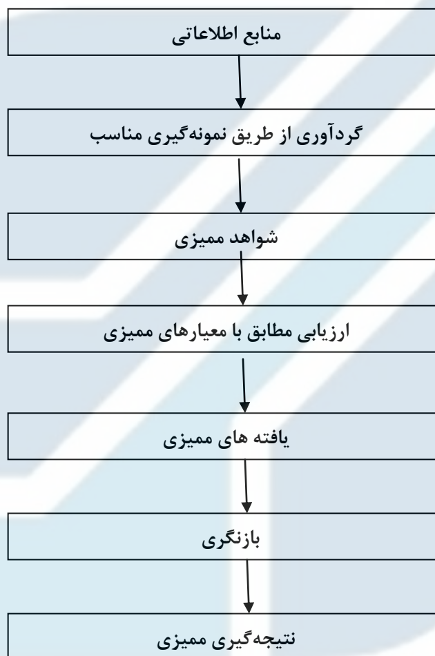
شکل ۳- دید کلی از فرآیند گردآوری و تصدیق اطلاعات

شکل ۳ دید کلی فرآیند ممیزی را از گردآوری اطلاعات تا دستیابی به نتیجه‌گیری‌های ممیزی ارائه می‌نماید.